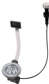
Automatischer Abfluss 8407 100