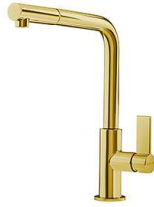
Mischbatterie Omega Plus Gold 8498 859