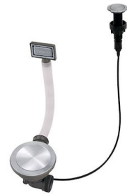
Automatischer Abfluss Space Push - PP 8407 116