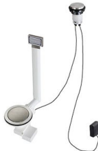
Automatischer Abfluss Space Light - PL 8407 117