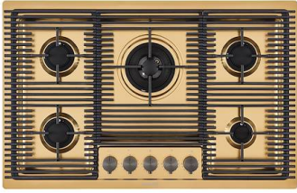
Kochfeld Milanello Gold 5F 7682 009