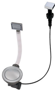
Automatischer Abfluss Space - PA 8407 108