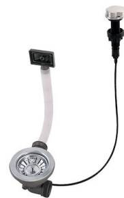
Automatischer Abfluss 8407 000