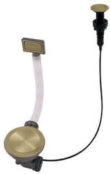
Automatischer Abfluss Space Push Gold 8407 121